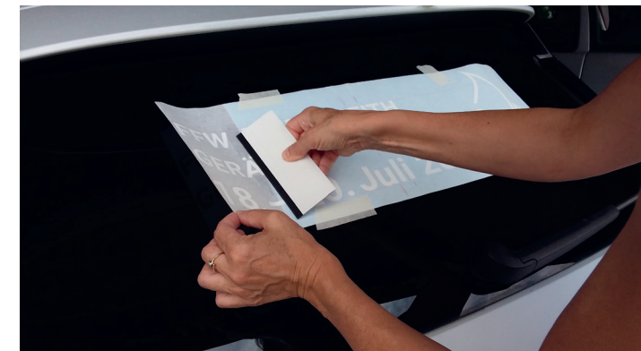
Plot anrakeln, weitere Vorgehensweise siehe Videos