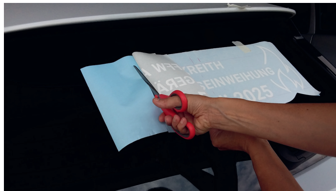
Trägerfolie darunter abschneiden