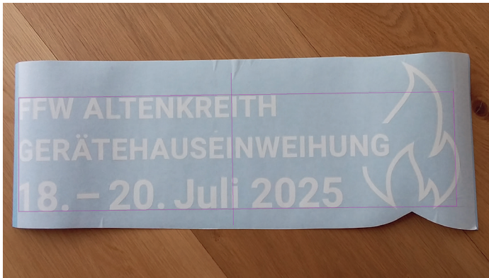
Auf die Übertragungsfolie vorsichtig ein Rechteck und eine Mittellinie setzen (kleinen Überstand an der Flamme berücksichtigen)