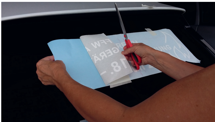
Übertragungsfolie samt Plot bis zum Krepp vorsichtig von der Trägerfolie (hellblau) abziehen

Vorbereitung: Die Heckscheibe muss schmutz-, fett- und staubfrei sein.