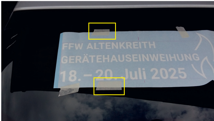
Weiteres Kreppband wie markiert anbringen