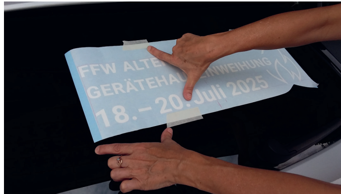
Übrig bleiben zwei Kreppstreifen wie im Bild, Abstand von links einhalten

Vorbereitung: Die Heckscheibe muss schmutz-, fett- und staubfrei sein.